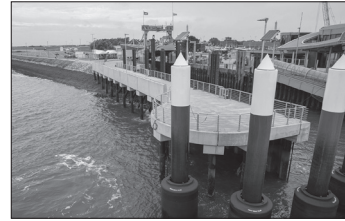
„Noch im Sommer soll die Südmole wieder begehbar sein.“