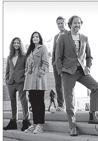
Heute im Kurtheater: das Quartett LaLeLu.

Die rund zweistündige A-Capella-Comedy-Show beginnt um 20 Uhr. Karten sind ab 23 Euro pro Person online unter www.norderney.de , an der Touristinformation im Conversationshaus und an der Abendkasse erhältlich.