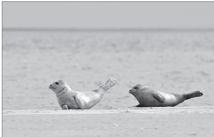
Seehundjunge warten am Strand auf die Muttertiere.