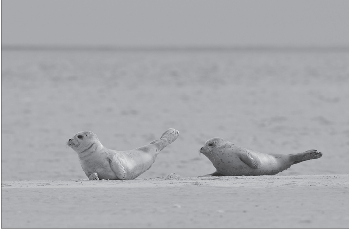
Seehundnachwuchs auf der Sandbank.

Norderney – Auf den Sandbänken sind die Seehunde aktuell gut zu beobachten und damit beginnt erneut die Zeit der Zählflüge. Ab heute beginnen die Mitarbeitenden des Niedersächsischen Landesamtes für Verbraucherschutz und Lebensmittelsicherheit (LAVES) mit den Seehundzählflügen im Nationalpark Niedersächsisches Wattenmeer, um den Bestand der Meeressäuger in der Nordsee zu ermitteln. Von Mai bis in den September sammeln sich die Seehunde auf den Sandbänken im Wattenmeer, um Junge zu gebären, sie zu säugen und um hier das Fell zu wechseln. Das LAVES plant fünf Flugtage mit zehn Flügen bis zum 13. August zu absolvieren. Dabei erfolgen die Zählungen zeit-