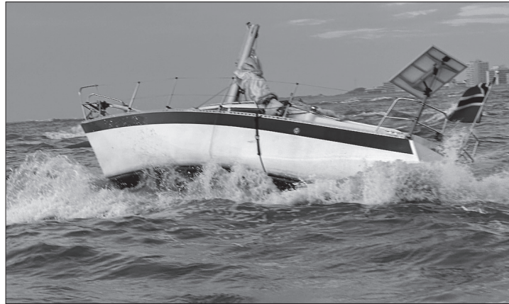
Nachdem eine Segelyacht vor Norderney auf einer Sandbank festgekommen war, sind Kiel und Mast gebrochen. Das stark beschädigte Boot war den Kräften der See schutzlos ausgesetzt.

Norderney – Die freiwilligen Seenotretter aus Norddeich retteten am vergangenen Freitagabend einen norwegischen Segler aus Lebensgefahr. Der 46-Jährige war zwischen den Inseln Juist und Norderney mit seiner Segelyacht auf eine Sandbank geraten und schließlich über Bord gegangen. Das teilte die Deutschen Gesellschaft zur Rettung Schiffbrüchiger (DGzRS) mit. Gegen 17.10 Uhr erhielt die Rettungsleitstelle See der DGzRS einen schwer verständlichen Notruf. Der Seenotrettungskreuzer EUGEN der Station Norderney, der zufällig in der Nähe war, fand die havarierte Yacht rund 2,5 Kilometer vor der Westspitze Norderneys. Aufgrund des Niedrigwassers war es den Rettern zunächst nicht möglich, die Yacht direkt zu erreichen. Die Besatzung versuchte, mit einem Leinenwurfgerät eine Verbindung herzustellen, doch der Skipper lehnte jede Hilfe ab.