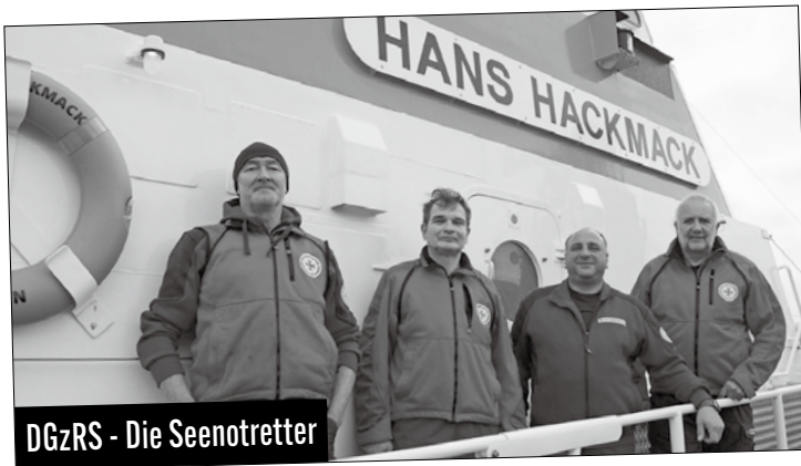
DGzRS - Die Seenotretter

„Wir sind als Feuerwehr auf Norderney 24 Stunden an sieben Tagen in der Woche einsatzbereit, auch an Silvester. Das Feuerwehrhaus Norderney wünscht dem Norderneyer Morgen und seinen Lesern einen aus unserer Sicht ruhigen Übergang in ein schönes neues Jahr 2023.“