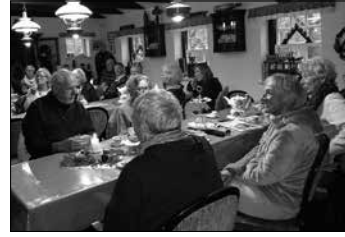
Besucher der Veranstaltung“, lautet das Fazit der Organisatoren.

des Vereins. Neben wahren Geschichten, Anekdoten und Döntjes wurde auch beschrieben, wie ein Weihnachtsstuten aussehen mußte und auch der Weihnachtsmann fand seine Zuhörer. Der Weihnachtsbaum durfte da ebenfalls nicht fehlen. „Alles in allem ein heiliger geselliger Nachmittag für die Mitwirkenden und die