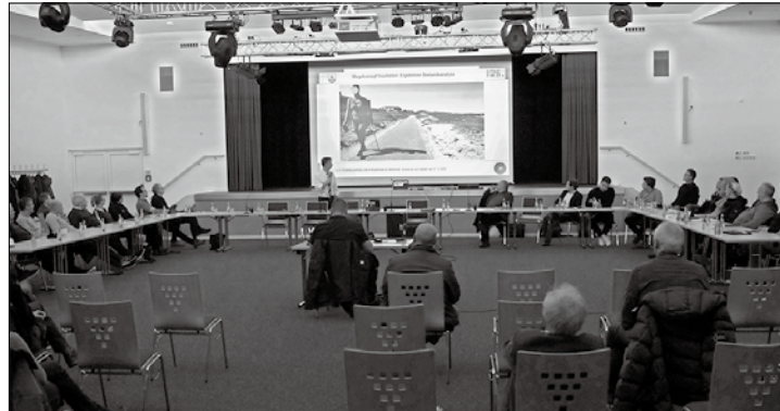
Um Verkehrslösungen für den Inselosten ging es bei der gemeinsamen Sitzung der Ausschüsse Verkehr und Umwelt am Mittwoch.

(dol) – Ein Gesamtkonzept für die Verkehrswege im Inselosten muss her, soviel ist klar, seit die Stadt Norderney vor rund einem Jahr mit Vertretern der Straßenverkehrsbehörde des Landkreises Aurich der Nationalparkverwaltung über eine Lösung für den Zuckerpad beraten hatte. Der Weg war im April durch den Landkreis für Radfahrer gesperrt worden, sodass Fahrradfahrer nun auf den Karl-Rieger-Weg ausweichen müssen. Viele ignorieren das Verbot jedoch und nutzen den Weg weiterhin als Radweg. Eine Verbreiterung des Weges könnte das Problem für die Straßenverkehrsbehörde lösen, scheiterte aber bisher an den geltenden Naturschutzbestimmungen. Die Nationalparkverwaltung hat aber in dem Gespräch für die Entwicklung eines Gesamtkonzeptes für den Inselosten einen konstruktiven Prozess