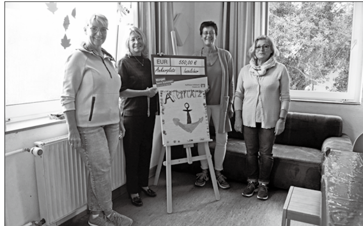
Die Spende wird in die Ausstattung des gerade eingerichteten Atelierraums fließen.