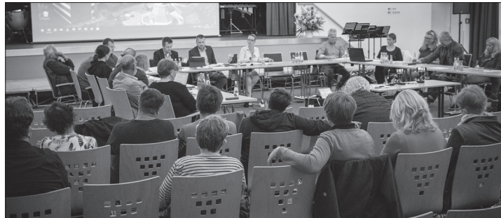
Ein Teil der Krankenhaus-Belegschaft verfolgte die Beratungen im Sozialausschuss.

(ape) – Mit der Sitzung des Sozialausschusses am Mittwochabend haben die Mitglieder erstmals öffentlich über eine mögliche Rekommunialisierung des Krankenhauses diskutiert. Während es noch vor einigen Jahren um das blanke Überleben des Inselkrankenhauses ging, steht die Einrichtung heute vergleichsweise gut da. Bürgermeister Frank Ulrichs bezeichnete es als einen gemeinsamen Erfolg durch das Engagement der Stadt, des Staatsbades und der Unterstützung aus den Reihen der Landespolitik. Hart für den Erhalt des Hauses haben zudem Gäste und Norderneyer Bürger gekämpft und dafür ihr Portemonnaie geöffnet. So konnte der Förderverein des Norderneyer Krankenhauses bislang 1,5 Millionen Euro an das privatgeführte Haus überweisen. Ulrichs dankte zudem der Belegschaft, die der Einrichtung trotz allem immer die Treue gehalten hat. Hinsichtlich eines möglichen Trägerwechsels, der auch von den bisherigen Gesellschaftern begrüßt wird, werden sich jedoch die Rahmenbedingungen