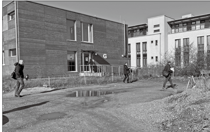
Ortsbegehung bei der Rehaklinik am vergangenen Donnerstag: Hier könnte zeitnah ein zweiter Funkmast aufgestellt werden.