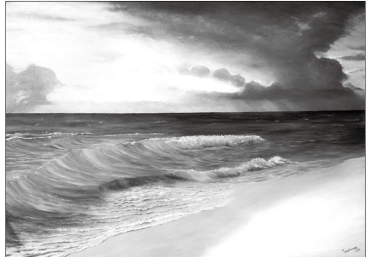
Die Liebe zum Meer, festgehalten auf Leinwand. Bild: Ehrenberg

Ehrenberg lebt seit acht Jahren auf Norderney und ist als Dozentin für kreative Kursangebote in unterschiedlichen Richtungen tätig, darunter Fotogestaltung, Malerei sowie Schrift- und Kartengestaltung. In dieser Ausstellung zeigt sie Bilder mit verschiedenen Techniken, die die Vielfalt der Insel und ihre Liebe zu Norderney ausdrücken. Ihre Freundin Rudlof erfährt