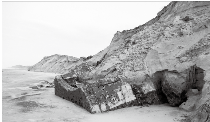
Eine ehemalige Flugabwehrstellung aus dem Zweiten Weltkrieg liegt derzeit am Fuß der Randdüne nahe der Kugelbake.

(ape) – Der Orkan Zeynep holte sich in der Nacht vom vergangenen Freitag auf Samstag ein gutes Stück Insel. Besorgniserregende Bilder zeigen sich an den Stränden mit hohen Abbruchkanten an den Randdünenketten, die an die schwere Sturmflut vom November 1981 erinnern. Die aktuelle Sturmflut hat die Überreste einer Flugabwehrstellung (Flakstellung) aus der Zeit des Zweiten Weltkrieges im Dünenbereich der Kugelbake nun wieder freigespült. Der sogenannte Bunker war im Laufe des Vormittags des 24. November 1981 abgestürzt.