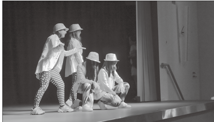
Schülerinnen und Schüler präsentierten einstudierte Tänze im Schwarzlicht.

(ape) – Rund 100 Menschen kamen am Donnerstagabend in der Aula der Kooperativen Gesamtschule zusammen, um eine Schwarzlichtshow zu genießen. 50 Schülerinnen und Schüler der siebten bis neunten Klassenstufe führten für Eltern, Geschwister und Mitschüler ein kurzweiliges und schwungvolles Programm in Neonfarben auf, bei denen die Kostüme die Blicke auf sich