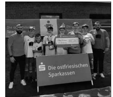
Stolz präsentieren die jungen Norderneyer Fußballer ihren Pokal nach dem Achtmeter-Schießen.

(ape) – Die jungen Kicker vom TuS erarbeiteten sich am vergangenen Samstag beim Sparkassen-Kreispokal in Großefehn den ersten Platz der D4-Junioren. Wegen der Corona-Pandemie war das Turnier zuvor verschoben worden.