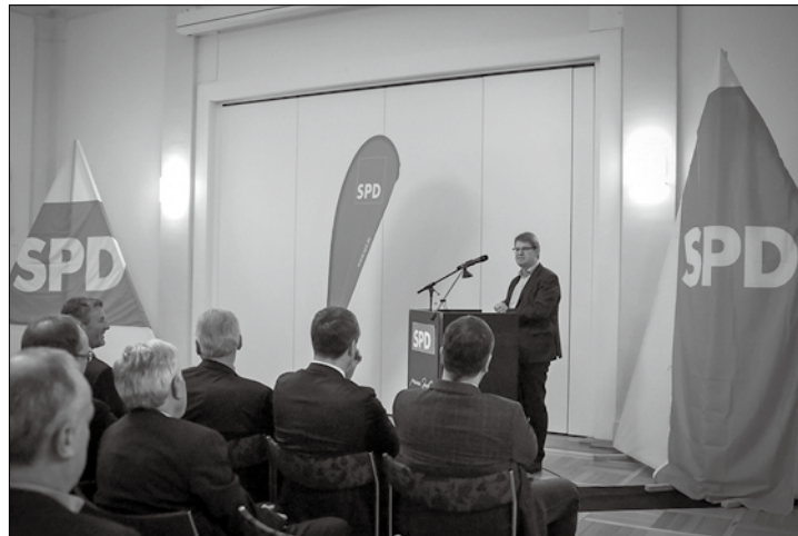
Über 120 Gäste begrüßte der SPD-Ortsverband zur 100-Jahrfeier im Conversationshaus. Darunter auch vom Bundesvorstand der SPD den stellvertretende Vorsitzende Ralf Stegner.

(ape) – Über 120 Gäste begrüßte SPD-Ortsverbandsvorsitzende Axel Stange am Samstag zur 100-Jahrfeier im Conversationshaus. Darunter auch Sozialdemokraten aus Landes- und Bundespolitik, Landrat Harm-Uwe Weber, die Mitglieder des Stadtrates sowie Bürgermeister Frank Ulrichs.