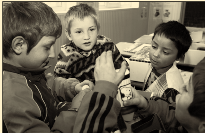
Rumänische Kinder freuen sich über Weihnachtsgeschenke.