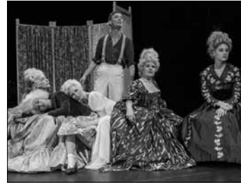
Die Landesbühne zeigt heute „Gefährliche Liebschaften“ im Kurtheater

romans „Gefährliche Liebschaften“ von Pierre-Ambroise-François Choderlos de Laclos im Jahr 1782 wurde von zahlreichen Skandalen begleitet. Königin Marie-Antoinette las ihn heimlich mit falschem Buchumschlag. Lange zur Erotik und nicht zur Literatur gerechnet, ist der Stoff ein Kräfteressen zwischen zwei intelligenten Verführern, die sich durch perfide Spiele mit den Gefühlen anderer Menschen einen zerstörerischen Machtkampf liefern.