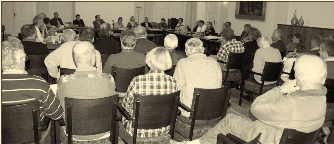
Warteten vergebens auf die Verkehrsdiskussion: Zuschauer im Weißen Saal im Conversationshaus.

Der Rat hält seine nächste Sitzung am Montag, 17. November, um 18 Uhr im Weißen Saal des Conversationshauses ab.