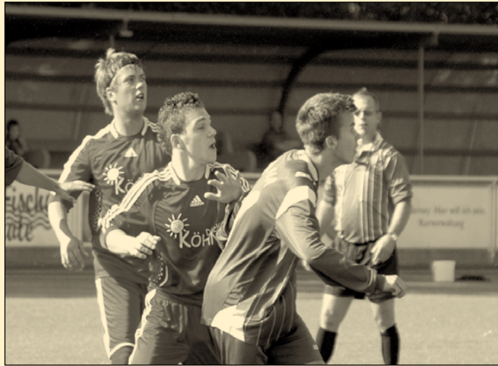
Der TuS steht derzeit auf dem elften Tabellenplatz.