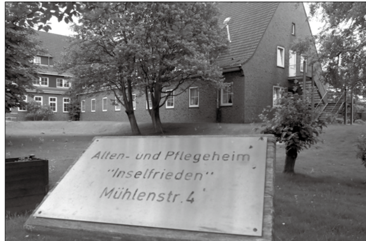
Im Inselfrieden muss die Belegung reduziert werden