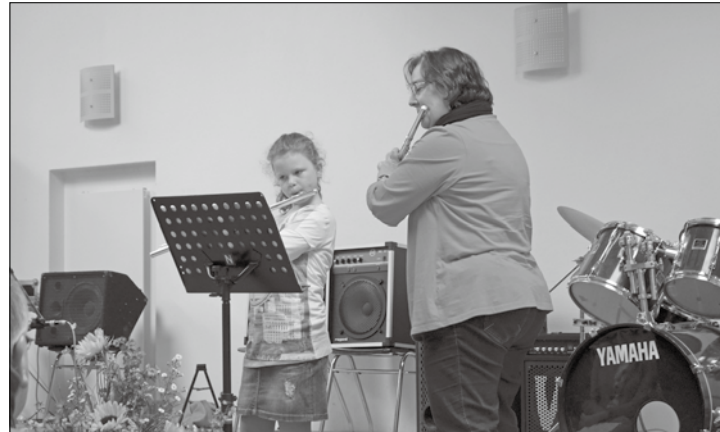
Morgen geben die Schüler der Musikschule ein Konzert im Orchesterraum der KGS.

Norderney – Um die Ergebnisse ihrer musikpädagogischen Arbeit zu präsentieren, veranstalten die Schülerinnen und Schüler der Musikschule des Landkreises Aurich gemeinsam mit ihren Lehrern ein Konzert in der Kooperativen Gesamtschule Norderney (KGS). Die Musikschule betreut mit sieben Lehrern die Bläserklassen der KGS sowie im Nachmittagsbereich den instrumentalen Unterricht. Es werden hier Querflöte, Klarinette, Saxophon, Klavier, Gitarre, E-Bass, E-Gitarre