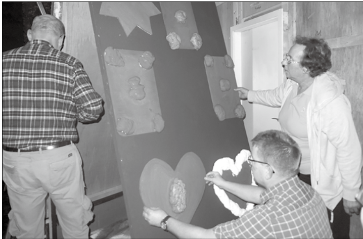
Der letzte Schliff fürs Bühnenbild wird gemacht.