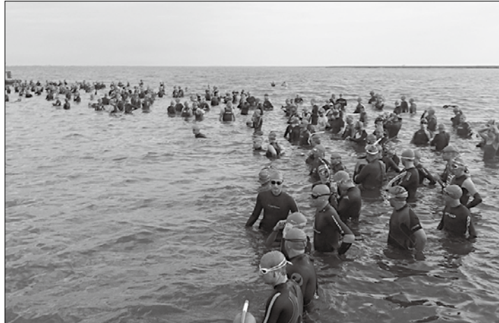
Kurz vor dem Start: die 286 Teilnehmer beim Inselfschwimmen der Deutschen Lebens-Rettungs-Gesellschaft.