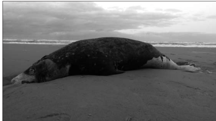
„Gerben“, so der Name dieser Kegelrobbe, begann sein Leben auf Ameland. Es endete am Strand von Norderney.

Norderney - Mitglieder der Norderneyer Ortsgruppe des Bundes für Umwelt und Naturschutz Deutschland (BUND) fanden kürzlich nahe der Weißen Düne eine tote Kegelrobbe am Strand. Es handelte sich um ein stattliches altes, über zwei Meter langes Männchen. Woran das Tier nun gestorben ist, konnte nicht ermittelt werden.