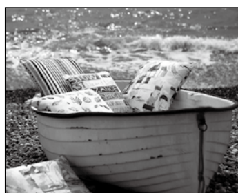
Polsterei Gardinen Plissee