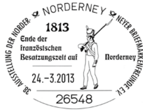
Sonderstempel zum Ende der französischen Besetzung auf Norderney

Die Schanze diente vor allem dem Rückzug der Soldaten, sollten Engländer auf der Insel anlanden. Sie ermöglichte einen weiträumigen Beschluss der zur damaligen Zeit angrenzenden größeren Ebene, so führt es der Norderneyer Stadtarchivar Manfred Bätje in einer kleinen Handreichung zur französischen