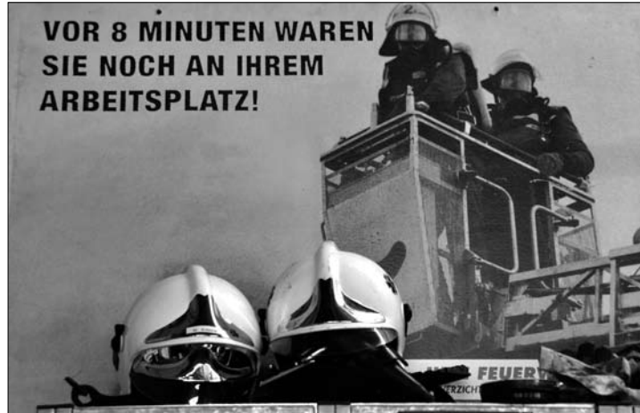
Die Feuerwehr Norderney sucht neue Mitglieder.

(der) – Alle, die schon immer Feuerwehrfrau oder –mann sein wollten, haben jetzt die Gelegenheit. Die Freiwillige Feuerwehr Norderney startet einen Lehrgang für Quereinsteiger, die bei null anfangen möchten.