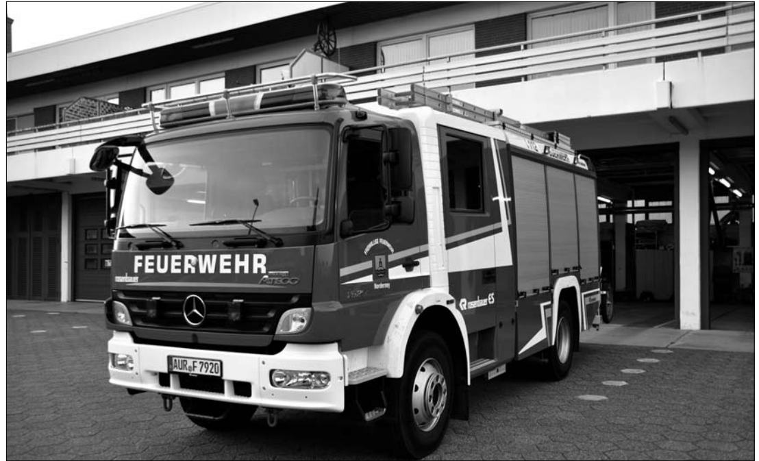
Wer darf die großen roten Autos fahren?