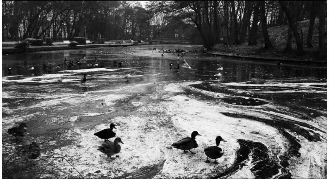
Das Eis am Schwänchenteich trägt Enten und Schwäne – aber nicht unbedingt Menschen.

Auf den Meiereiwiesen sind in den vergangenen Tagen Schlittschuhläufer gefahren. Die Wiesen sind mit vereistem Wasser überzogen, das etwa 15 bis 20 Zentimeter tief sei, so Kampfer. In früheren Jahren habe die Feuerwehr die Wiesen geflutet, das war in diesem Winter nicht nötig. Auf den Wiesen am Karl-Rieger-Weg sei das Schlittschuhlaufen zwar relativ harmlos, doch auch da gebe es unsichere Stellen: ein Meter tiefe Bombentrichter. „Das kann schon reichen“, sagt Kampfer.