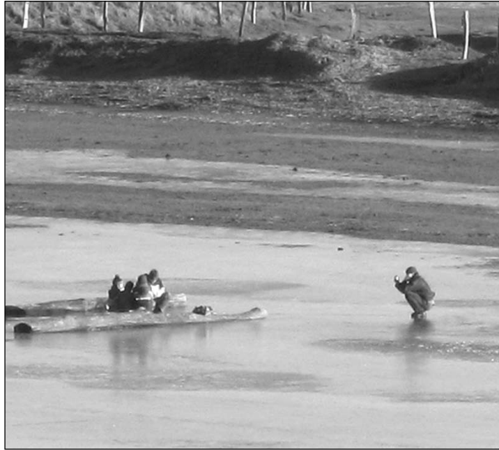
Eisiges Vergnügen auf den Meiereiwiesen.